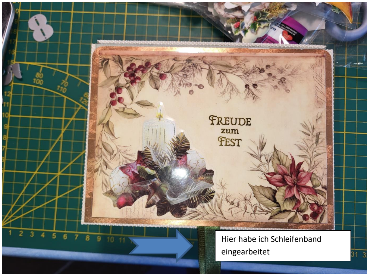
Hier habe ich Schleifenband eingearbeitet